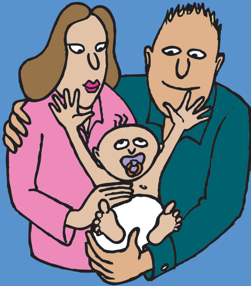
Vielleicht bei Familie Müller?

So etwas kann in vielen Familien passieren: